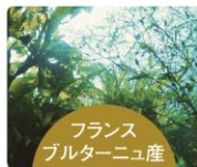
海藻エキス(毛髪保護成分)