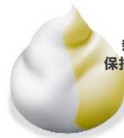
泡のヘアカラー・エクストラリッチ