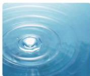
加水分解コラーゲン(毛髪保護成分)