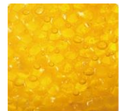
ロイヤルゼリーエキス(うるおい成分)