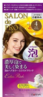
リニューアル前のパッケージ