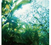
海藻エキス(毛髪保護成分)