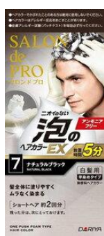
リニューアル前のパッケージ