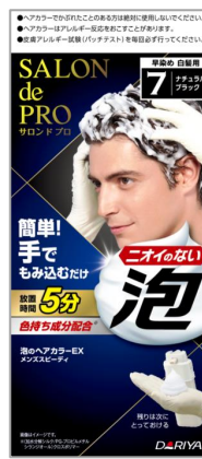
7<ナチュラルブラック>