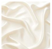
シルクプロテイン(つややか成分)