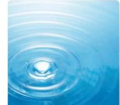
加水分解コラーゲン(はり・コシ成分)