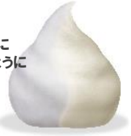
泡のヘアカラーEX メンズスピーディ