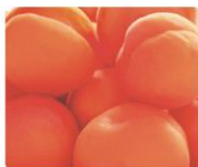
アンズエキス(うるおい成分)