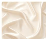
シルクプロテイン(つややか成分)