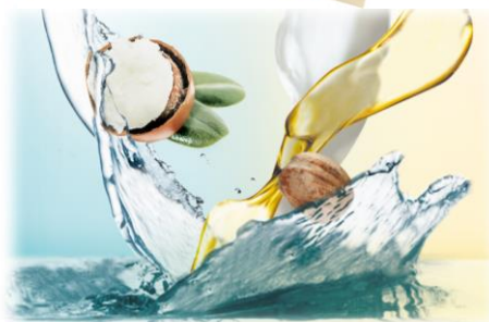
●画像はイメージです。