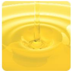
ホホバ油 ＜毛髪保護成分＞