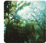
海藻エキス※2 ＜はり・コシ成分＞ ※2 ヒバマタエキス