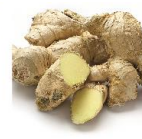
ウコンエキス ＜うるおい成分＞