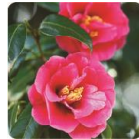
椿オイル ＜つややか成分＞