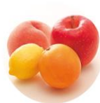
保湿成分 ※ (4つの果実抽出エキス)