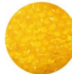
うるおい成分 (ロイヤルゼリー)