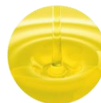
毛髪保護成分 (ホホバオイル)