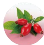
つややか成分 (ローズヒップオイル)