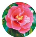
つややか成分 (つばきオイル)