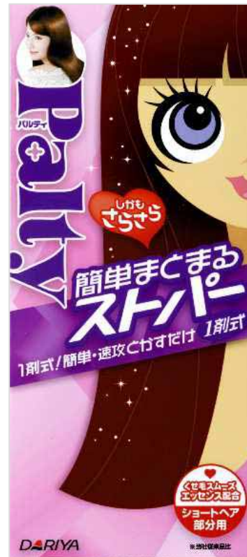
簡単まとまるスパー