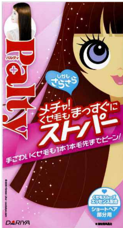
メチャまっすぐスパー