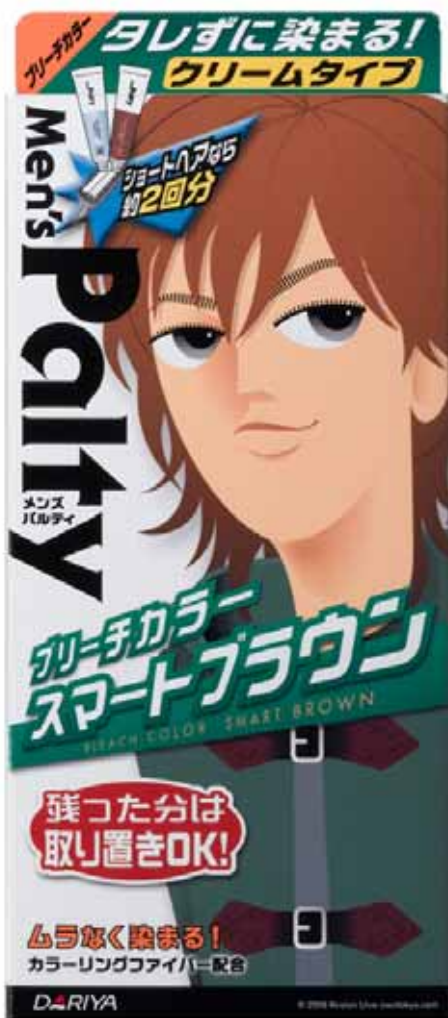
スマートブラウン