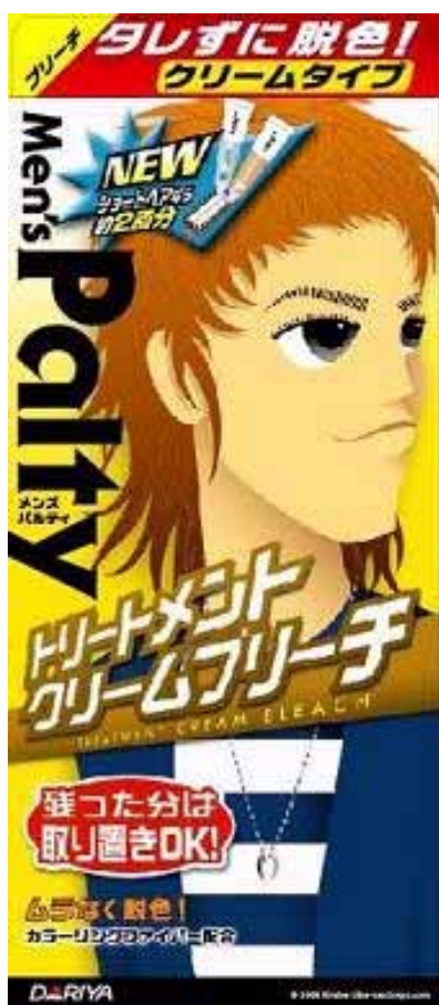
トリートメント クリームブリーチ